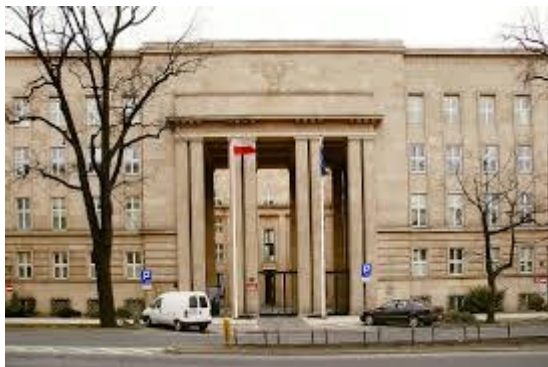
MINISTERSTWO EDUKACJI NARODOWEJ