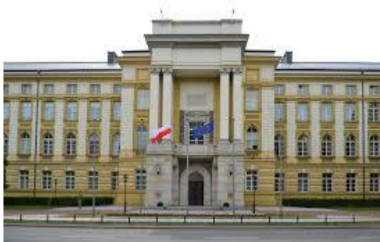
KANCELARIA PREZESA RADY MINISTRÓW